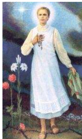
bł. K. Kózkówna