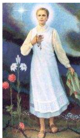
bł. K. Kózkówna