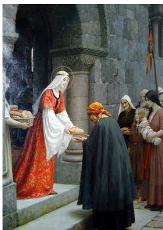
św. E. Węgierska