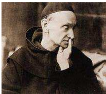
św. R. Kalinowski