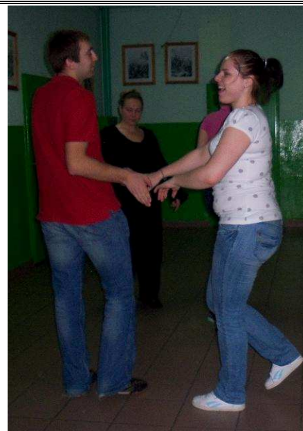
Pierwsze kroki taneczne z wdziękiem stawiają dorośli, młodzież i ...