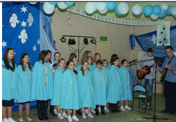
Nasza młodzież zaprezentowała się w tańcu i śpiewie.