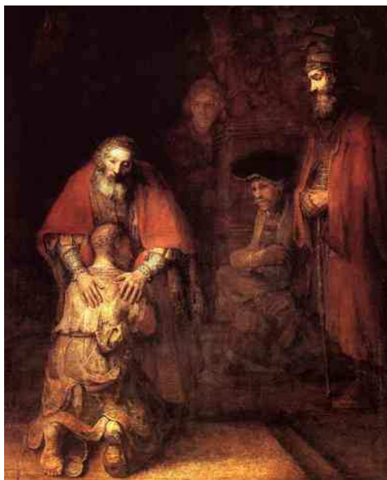
Powrót syna marnotrawnego

Największą i najgłębszą potrzebą każdego człowieka jest potrzeba miłości. Bóg, który jest Miłością, wychodzi naprzeciw tym pragnieniom, a czynić to pragnie poprzez chrześcijan, którzy mają być świadkami i przekazicielami tej miłości. Jeśli więc chcemy pozyskiwać innych ludzi dla Boga, zdobywajmy ich przez miłość. Jeśli pragniemy uczynić ich szczęśliwymi, obdarzajmy ich miłością. Jeśli myślimy o tym, co pozostawić po sobie potomnym, niech to będzie wspaniały przykład miłości.