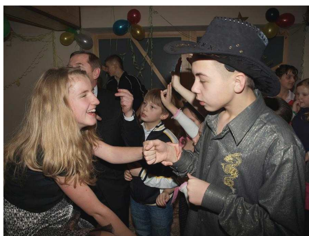
Wesoło bawią się dzieci, młodzież i Ks. Proboszcz