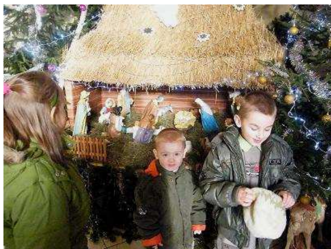
Przy szopce chętnie gromadzą się dzieci.