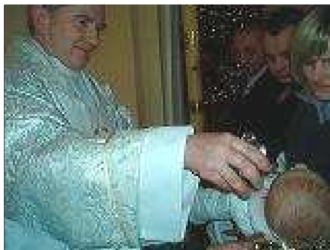
Ks. Proboszcz udziela 39 chrztu w tym roku.