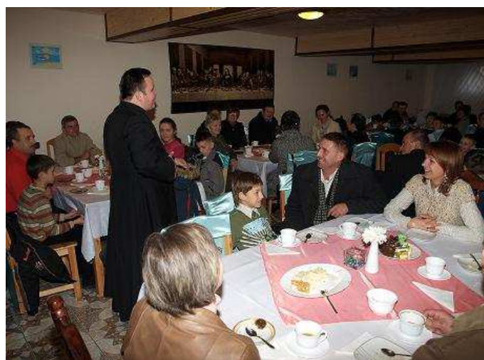
Spotkanie w Kawiarence Oratoryjnej.